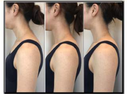
Before After +バリエステ

バリエステをプラスする事でより背中がスッキリ、首はもちろんフェイスラインもシャープに!